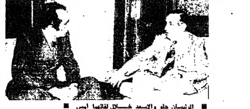
الرئيسان حلو والاسعد خلال لقاءهما امس